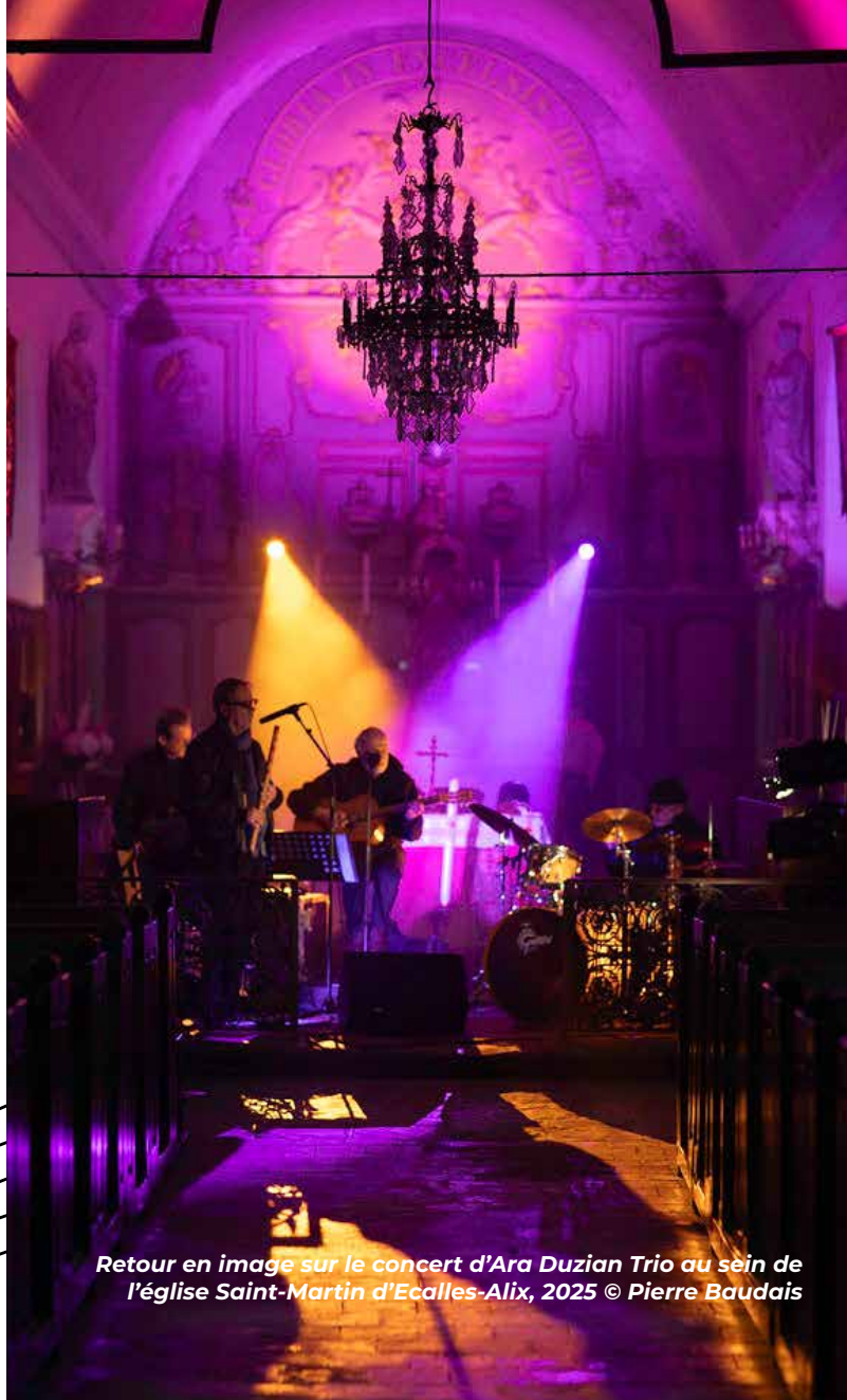
Retour en image sur le concert d'Ara Duzian Trio au sein de l'église Saint-Martin d'Ecalles-Alix, 2025